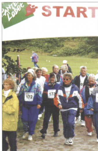
Panterdagen starter med en frisk gå- eller løbetur på 3 eller fem km.

Middelfart Firmasport arrangerer den 29. maj årets første Panterdag. Motion, samvær og underholdning er nøgleordet, når startskuddet lyder til Panterdagen kl. 13.00 på Fænøvej, ved Middelfart Firmsports klubhus. Panterdagen er Panterbevægelsens flagskib, der udover et motionsløb også byder "Panterne" på en festlig dag med masser af aktiviteter, boder og underholdning.