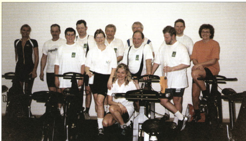
Spinningholdet i Slagelse.

idræt førte imidlertid til en henvendelse fra Sønderjyllands Amtskreds. Lørdag den 17. april besøgte 32 folk fra Sønderjylland SFS for at se spinning. Vi mødte dem i Squash & Fitness, og efter en kort introduktion fik de selv lov til at prøve hvad spinning er.