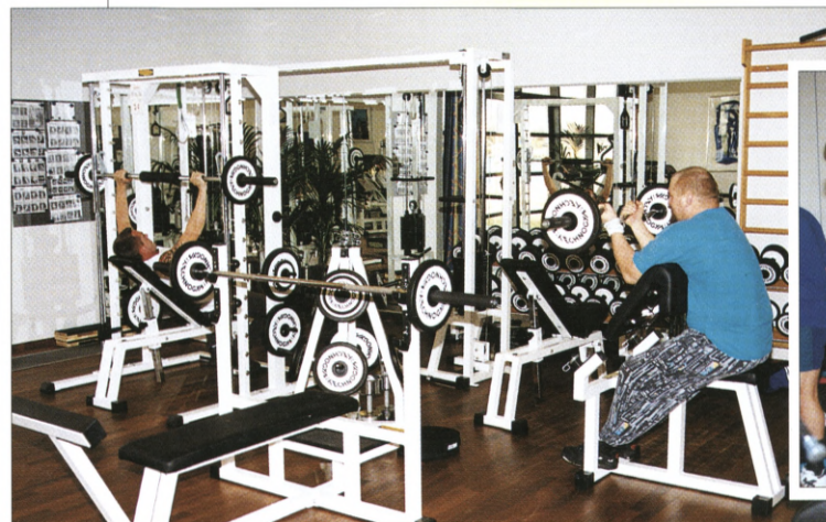
Medarbejderhuset rummer også lokaler til styrketræning.

bold, badminton, roning og skydning, har idrætsklubben også bordtennis, billard, bridge, bowling, golf og motionsløb på programmet. ♦