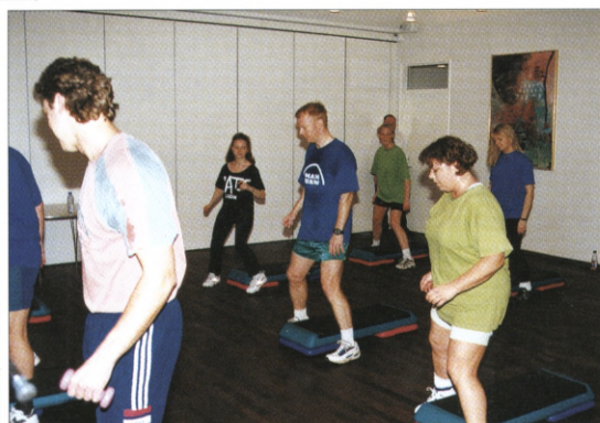
Der er aerobic og step flere gange om ugen i huset.