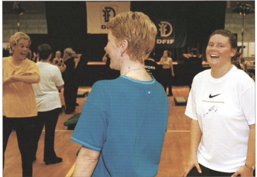
Hele Danmark skal svede for en god sag når Hjerteforeningen og DFIF indbyder til aerobic i 35 byer.