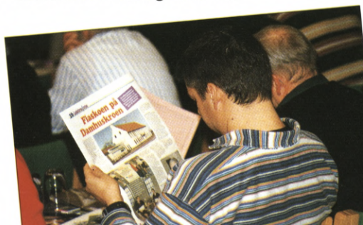
Strukturdebatten fik konkurrence af Landsstævneavisen om formændenes opmærksomhed.