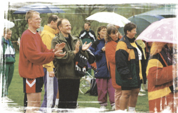
Løberne klappes i mål.