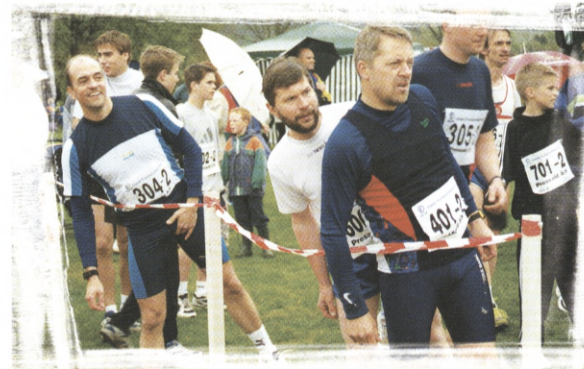
Hvor bliver de af? Der spejdes efter den første løber på holdet.