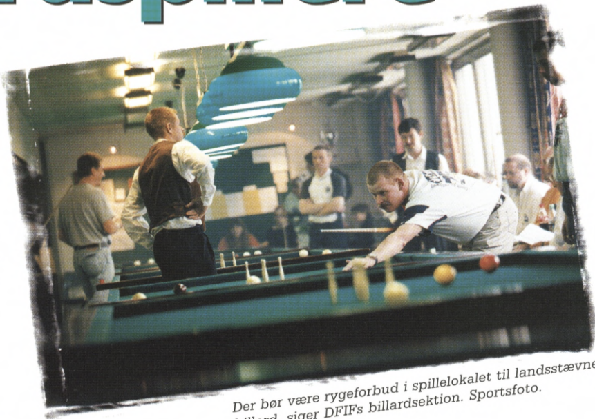
Der bør være rygeforbud i spillelokalet til landsstævnet i billard, siger DFIF's billardsektion. Sportsfoto.

Stævneledelsen kan ikke klandres for forsinkelserne i tidsplanen. De tider der var afsat til afvikling af de enkelte holdkampe, er tider som erfaringsmæssigt er blevet opsamlet fra tidligere stævner. I skriver, at finalen skulle afvikles på 3 borde p.g.r.a. tidsnød. Det er ikke rigtigt, for vi har ikke noget bestemt tidspunkt vi skal være færdige på, men da mange har en lang hjemrejse, og der samtidig var mange til at