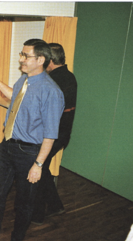
Formændene måtte en tur i stemmeboksen efter lørdagens debat.