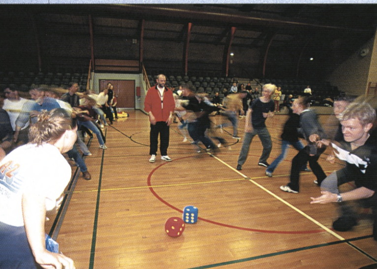
Opvarmning med Terninge Tagfat.

Det hele blev rundet af med en stafetkonkurrence, hvor grupperne skulle konkurrere i hockeydribling, pedalofræs og terningekast - hurtigste hold vandt. Til de lidt mindre børn var der opstillet en hoppepude, og hele dagen sluttede med fælles frokost.