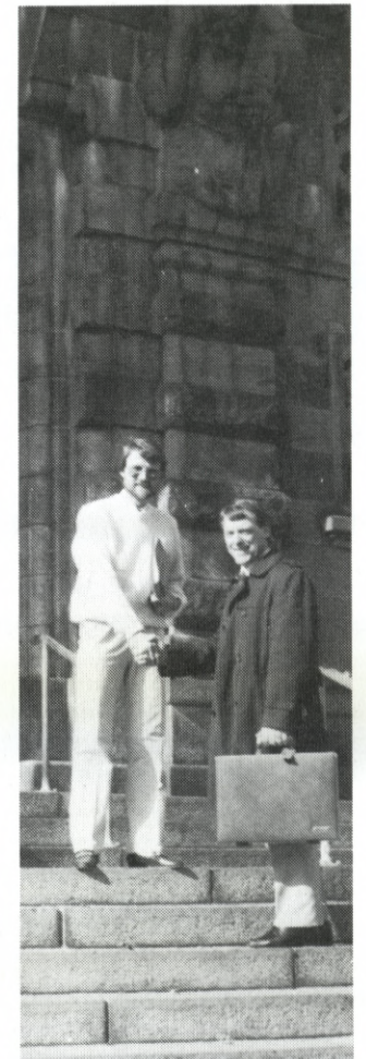
Helge Sander tager imod på Christiansborg

På Christiansborg venter Helge Sander. Der skal holdes uformelt møde, hvilket