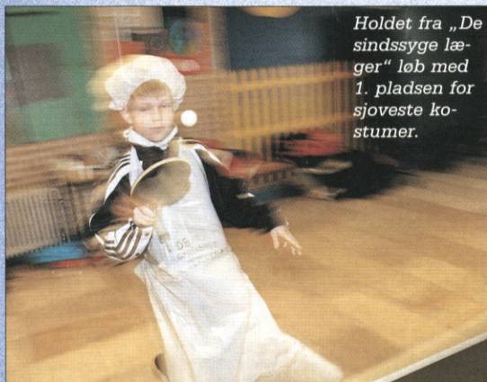
Holdet fra „De sindssyge læger“ løb med 1. pladsen for sjoveste kostumer.