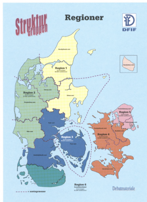
Regionsmodellen opdeler Danmark i 6 regioner inkl. Landskredsen, og det er en model, som strukturgruppen og DFIF's styrelse ser mange fordele ved. Grafik: Ole Rasmussen.

Metoden er, at gøre de økonomiske tilskud til kredsene afhængige af aktivitetsniveauet. Der skal stadig udbetales et grundtilskud til kredsens administration, men alle andre tilskud gøres aktivitetsafhængige. Der afsættes en pulje til Grand Prix-stævnerne, til nye tiltag på idrætsområdet, til DM-stæv-