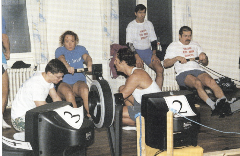
Vagns 4 brødre (gennemsnitsalder 48 år!) og Family fitness måtte se sig henvist til henholdsvis 2. og 3. pladsen, hvor skulle 3 sekunder skilte de to hold ad efter 2000 m roning.

Holdene med den 6. til 10. bedste tid kvalificerede sig til B-finalen hvor der blev kæmpet om placeringerne fra nr. 6 til 10. B-finalen blev vundet af arkitektfirmaet Friborg og Lassen, i tiden 5 min, 47 sek. En tid, som ville have placeret dem som nummer 4 i A-finalen. Her blev de altså straffet for at have „fedtet“ med kræfterne i det indledende heat.