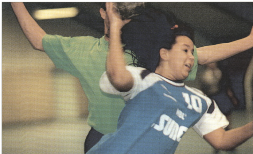
Danmarks største håndboldstævne for firmahold i Tønder den 10.-11. april.

og Vest-Agder bedriftsidrett, Norge fortsætter samarbejdet omkring Choice Cup i 1999. I år er Aalborg vært for et stort idrætsstævne, der afvikles den 25.-26. september. Arrangørerne forventer over 1000 norske og danske idrætsfolk til stævnet.