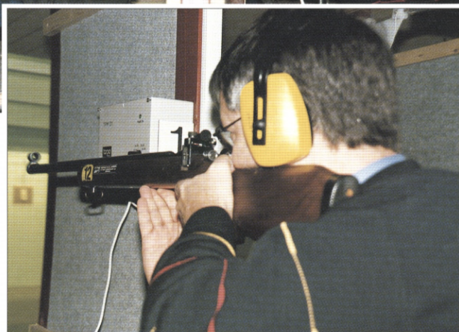
Sigtet er lagt an til masser af aktivitet for firmaskytterne i Silkeborg. 24 kan nu hæve riflen eller pistolen ad gangen i Arena Centret.