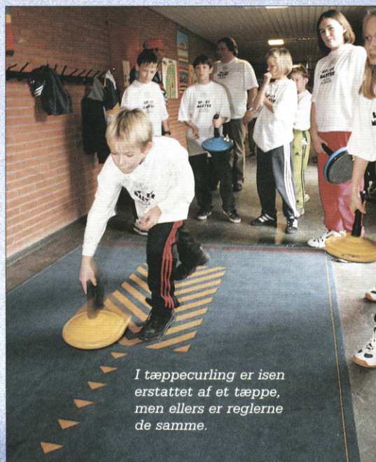
I tæppecurling er isen erstattet af et tæppe, men ellers er reglerne de samme.