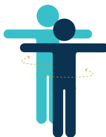
Snor rundt om dig selv