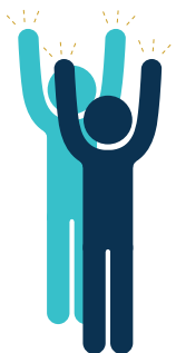
High five makkeren med begge hænder