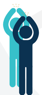
Klap over eget hoved