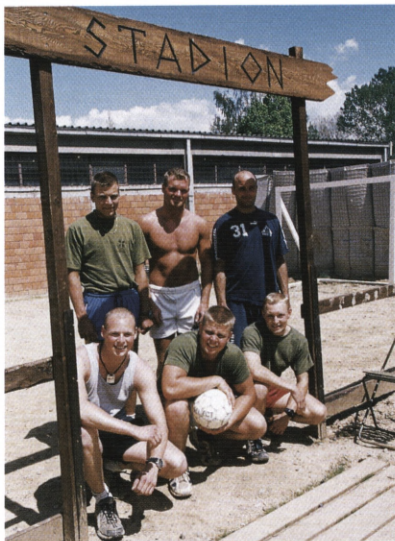
75 % af de danske soldater dyrker en eller anden form for idræt udover det de skal i forbindelse med jobbet som soldat. Her er et fodboldhold klar til en dyst på grusbanen på Stadion i Holger Danske lejren i Kosovo.

feltet. Det bliver i øvrigt den enkelte nations nationalflag, som bliver depechen under løbet, som finder sted i starten af juli, siger Kasper Damsø og fremviser en imponerende oversigt over bataljonens større idrætsaktiviteter for april til juli.