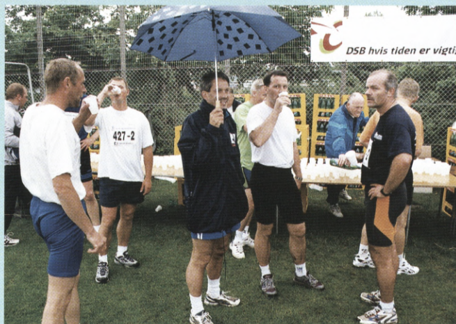
Kondivandet sponsoreret af Faxe Kondi var en kærkommen forfriskning for løberne.