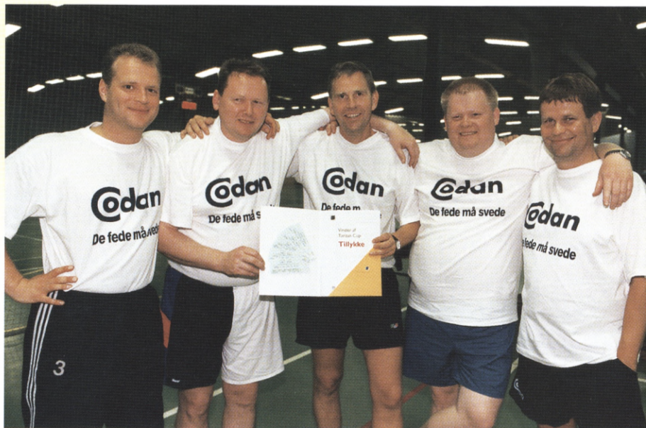
Holdet fra Codan Forsikring smed 55 kg og vandt Tarzan Cup.