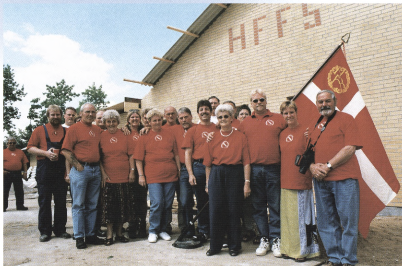
Rejsegilde: Glæde hos rækken af frivillige, der står bag byggeriet af nyt skydecenter og klubhus i HFFS.

Fra det første spadestik blev taget den 1. april og frem til 20. maj ved rejsegildet, er byggeriet skredet frem med forbavsende hast, og HFFS regner med at kunne tage de nye bygninger i brug i midten af september. Til den tid rå-