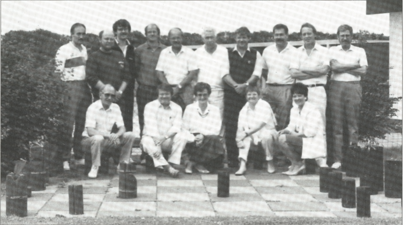
Alle deltagerne ved høringen i Oksbøl.

I weekenden fredag den 12. august til søndag den 14. august havde Dansk Firmaidrætsforbunds kursusudvalg indkaldt til høring om DFIF's lederuddannelse. De spørgsmål, som blev rejst, var: