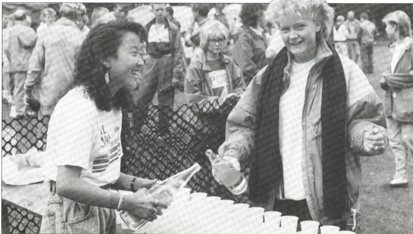
To piger fra Esbjerg sørgede for at løberne ikke kom til at mangle væske undervejs. Vejrguderne havde fået den samme idé.

Som bekendt er Esbjerg efternøler, når det drejer sig om afviklingen af Danmark Stafetten. Grunden er den, at juni måned, hvor 5 andre byer i landet afvikler stafetten, afvikler Esbjerg Atletikforening og Esbjerg Firmaidræt Danmarks tredjestørste motionsløb, Vestkystløbet.