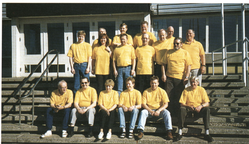
15 nye glade og stolte billardinstruktører med den gule førertrøje.

Derfor er det også en fast tradition indenfor instruktøruddannelsen i billard, at alle efter kursus III samles til et fælles foto. Både kursister, instruktører, medinstruktør og kursusleder. Det var også tilfældet i januar måned, hvor endnu et hold gule instruktører så dagens lys. Til forskel fra andre gange var alle klædt i gult, der jo er uddannelsens farve i DFIF. Alle var stolte og glade, for ikke blot er den gule førertrøje et tydeligt bevis på den nye instruktørstatus, men vi