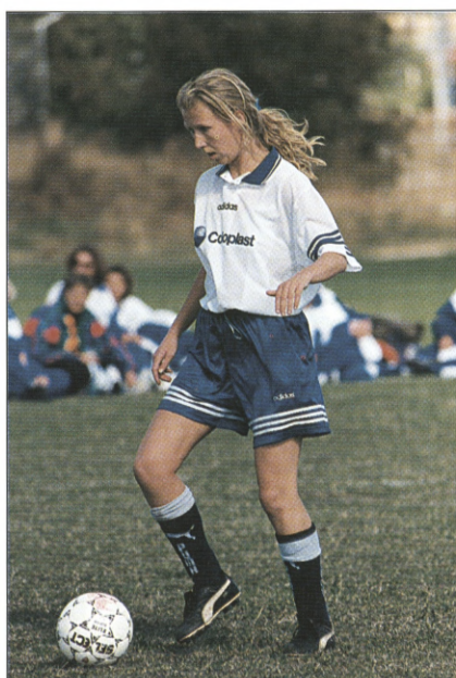
Der skal spilles udendørs 5 mands mixfodbold ved Triat/bold-stævnet i Helsingør.

Det koster kun 360 kr. pr. hold at deltage, og der er fri tilmelding. Alle kan deltage uanset styrke fysik og kondition, og man er sik-