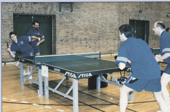
Der blev spillet over 400 kampe ved bordtennislandsstævnet.