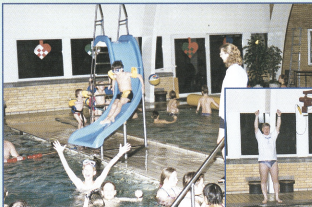
Familiesvømning er den største aktivitet i Vamdrup Firma Sport.

- Det er unge mennesker, som på en god måde skaber den ro og