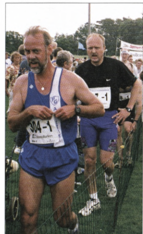
Den fugtige luft i Herlufsholmskoven gjorde ikke turen lettere.

Fortalte jeg i øvrigt, at den hurtigste løber blandt herrerne kom i mål på kun 15 min. og 19 sek. Hos kvinderne var den hurtigste tid 16 min. og 3 sek.