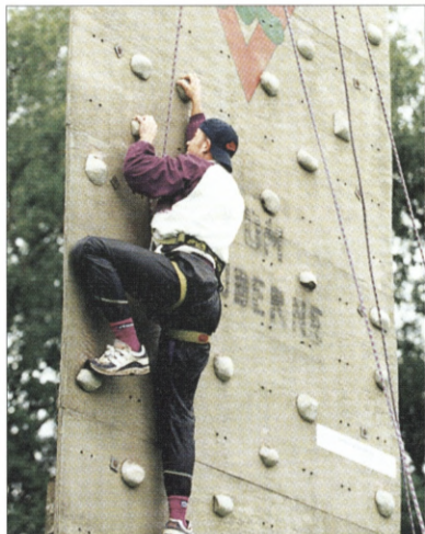
Vestfyns Firmaidræt tager ny klatrevæg i brug.

Under mottoet „ kom på toppen med firmaidrætten“ tager Vestfyns Firmaidræt nu en ny klatrevæg i brug. Det sker i Assens den 29. August kl. 16. I første omgang skal klatrevæggen hænges op i Assens-hallen, men klatrevæggen er transportabel og kan gøres højere. Der er tanken at væggen skal bruges til mange forskellige arrangementer. Vestfyns Firmaidræt råder over alt sikkerhedsudstyr, så klatringen kan foregå på forsvar-