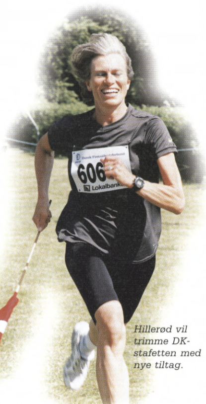
Hillerød vil trimme DK-stafetten med nye tiltag.