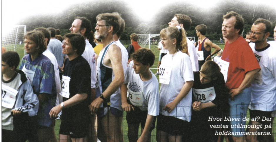
Hvor bliver de af? Der ventes utålmodigt på holdkammeraterne.