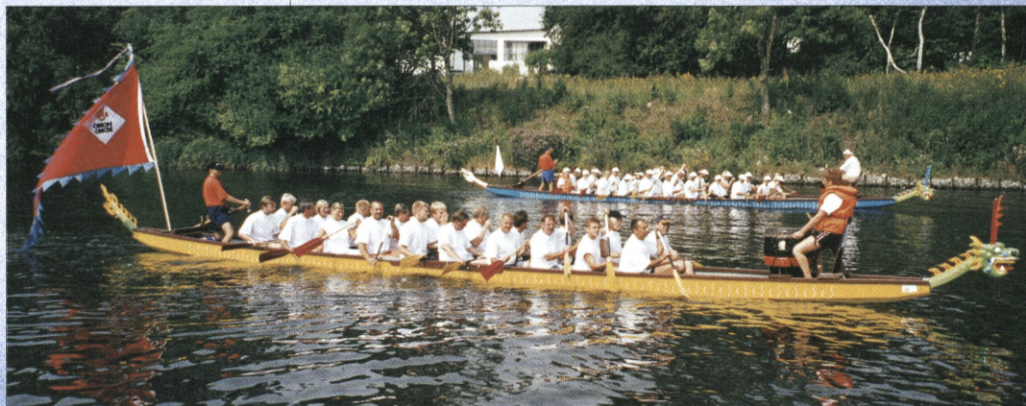
Dragebådene kommer oprindelig fra Kina, og drives frem af tyve roere, mens takten bliver markeret på en stor tromme.