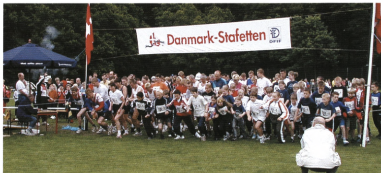
Med 42 skolehold på startlisten, var skolebørnene i forreste række ved Danmark-Stafetten i Hillerød.

Bortset fra et par skolehold der kom til at løbe en lille omvej, kom