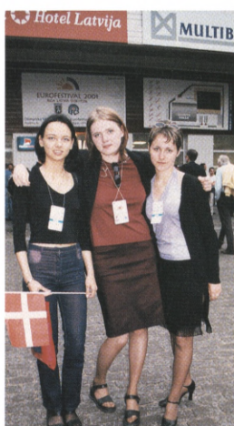
Guider til alle hold.