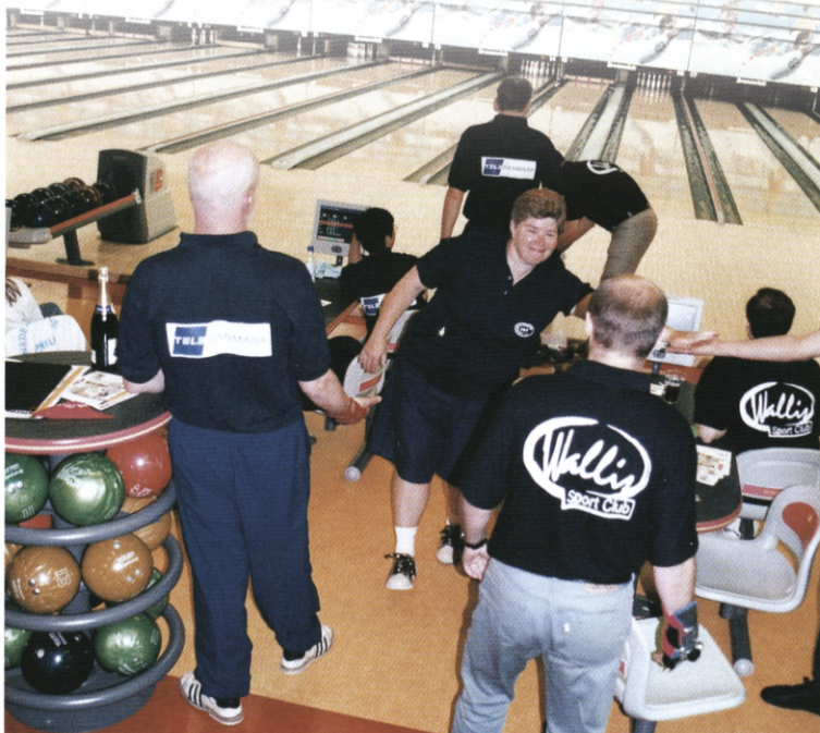
Bowlingholdet fra IK Telefonen blev nr. 6 i turneringen. De tabte til de senere vindere fra Ungarn, Wallis Sport.

IK Telefonen lagde ud torsdag med at blive nr. 2 i deres pulje med en total på 1854 kegler. Den første kamp blev tabt til et norsk hold fra Kongsberg Olie, men så havde telefonfolkene fået styr på nerverne og bowlingkuglerne og fik spillet til at glide. Om fredagen gik det endnu bedre. Puljen med to'ere gav 3 sejre og en score på 2012 kegler, og så