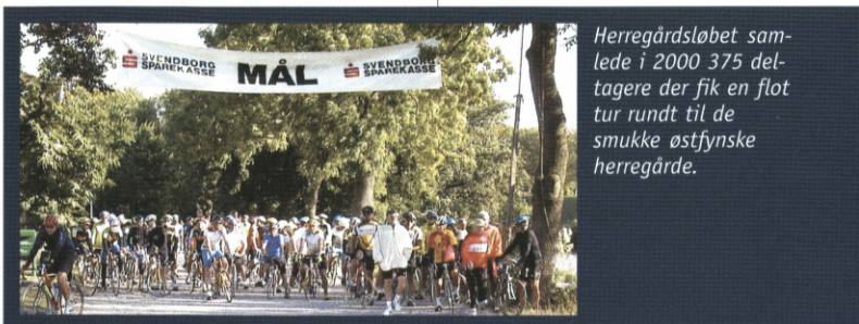
Herregårdsløbet samlede i 2000 375 deltagere der fik en flot tur rundt til de smukke østfynske herregårde.