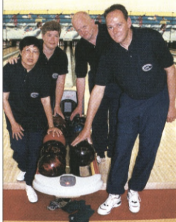
IK Telefonen, Odense Nr 6. i bowlingturneringen.