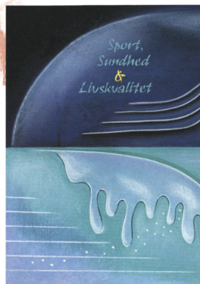
DFIF's nye uddannelseskatalog byder på såvel på nye som gammelkendte kurser med masser af inspiration til alle aldre.

glip af de nye inspirerende kurser som firmaidrætten kan tilbyde dig og dine kolleger. I det store nye uddannelseskatalog finder du både nyheder såvel som kendte kurser, og her får du en smagsprøve på i nogle af de kurser, den kommende kursusæson kan tilbyde dig.