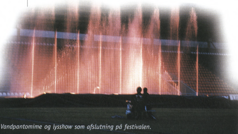
Vandpantomime og lysshow som afslutning på festivalen.

En flot vandpantomime med lysshow skænket af Riga by satte et festligt punktum for 5 dage i Riga med masser af gode oplevelser og minder for alle de 3500 sportsfolk fra 20 lande. ■