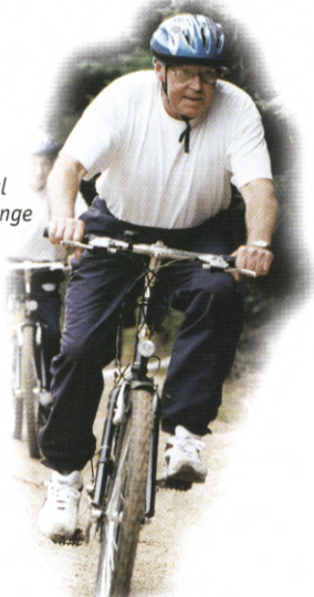
Seniorerne skal bl.a. køre Tåsinge Rundt på mountainbike.