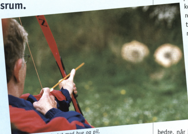
Præcisionen blev testet med bue og pil.

Foryggende oplevelse med spændende friluft aktiviteter da unge og ældre mødtes for at bruge naturen som motionsrum.