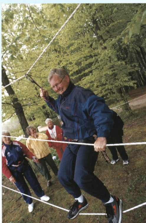
To rebs gangbro kræver både en god balance og gode armkræfter.

Solen tittede frem og gjorde dagen endnu mere indbydende, da unge og ældre mødtes og gjorde sig klar til det, der skulle vise sig at blive en forrygende dag i Mølleparken i Aalborg.