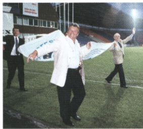
EFCS-banner til Salzburg.