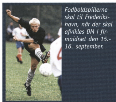
Fodboldspillerne skal til Frederikshavn, når der skal afvikles DM i firmaidræt den 15.-16. september.

Indbydelserne til alle DM stævner i firmaidræt sommer er nu sendt ud til DFIF's kredse og foreninger. Med undtagelse af DM i firmaidræt i beachvolleyball, skal alle tilmeldinger indsendes via kredsen senest den 1. august og være