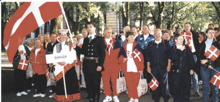
Optog gennem Riga.