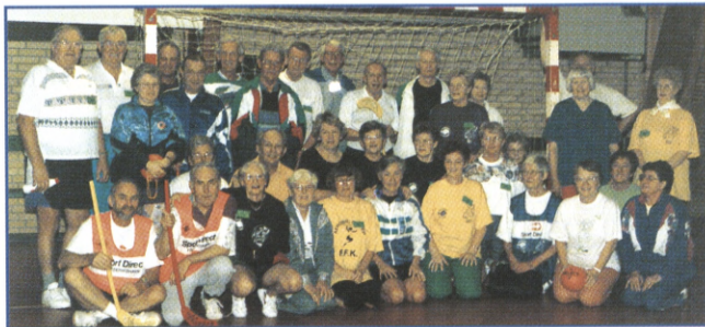
Senior-idræt Ud på gulvet i FFK samler hver onsdag 60 aktive seniorer til idræt og samvær.

Centret. Her mødes omkring 60 seniorer til en omgang vedligeholdelse af kroppen. Der startes med fælles opvarmning og gymnastik, inden seniorerne fordeler sig ud i halterne til forskellige former for idræt. Tilbuddene spænder vidt, lige fra bad-