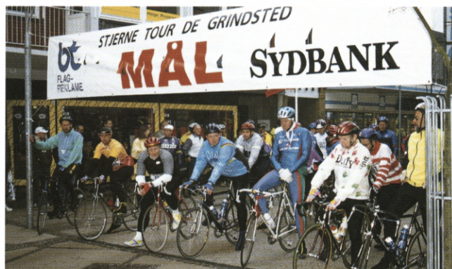
Afslappet stemning ud for Sydbank på Torvet i Grindsted før starten på den lange tur på 234 km.

- Vi vil hellere sørge for, at alle tager hjem fra Grindstedegnen med en god oplevelse og et indtryk af et cykelløb, hvor alt fungerer, og hvor forventningerne er indfriet.