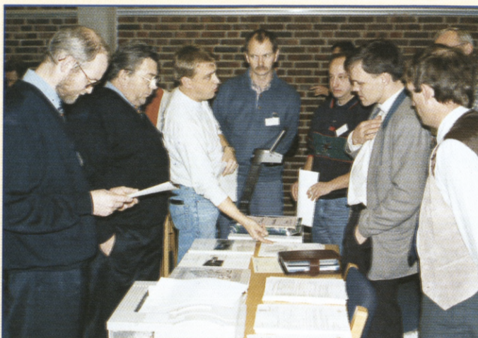
DFIFs EDB-gruppe benyttede lejligheden til at demonstrere forbundets EDB-programpakke.

F ormændene i DFIFs kredse og sammenslutninger er tilfredse med forbundets øverste ledelse og måden den forvalter tips- og lottopengene på. Det må være den umiddelbare konklusion efter DFIFs formandsmøde i slutningen af november. Gennemgangen af budgettet og vedtagelsen af fordelingen af de ca. 25 mio. kr. som DFIF modtager i 1997 tog kun ganske få minutter, og gav ikke anledning til debat eller spørgsmål fra forsamlingen.