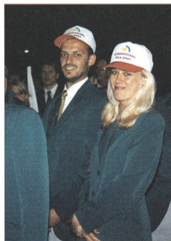
Riga er vært når den næste sommerfestival finder sted i 2001.