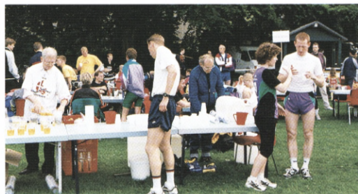
Det var fjerde gang at DK-Stafetten blev afviklet i Fælledparken, og løbet er blevet en fast tradition for mange løbere.

Løbets sponsorer er med til at gøre det ekstra festligt. Københavns Ungdomscenter stiller borde, stole og telt gratis til rådigh-