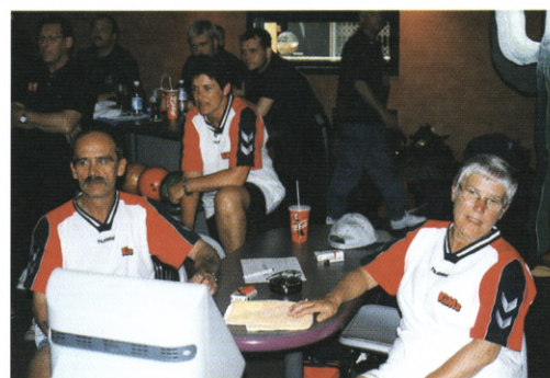
Bowlingsspillerne fra Kims sikrede sig en 4. plads i D-finalen.

Vi har desværre ikke placeringerne for alle de ca. 40 danske hold. Vi har kun placeringerne for de fire bedste hold i hver række. I D-rækken var det danskerne der satte sig på det hele. Nr. 1 Dr. Adams, nr. 2 HI København, nr. 3 IK Telefonen, nr. 4 Kims. Vi kan meget vel have haft hold i A, B og C-rækkerne, men de er ikke blevet mellem de første 4 og i skrivende stund har vi ikke deres placeringer. ♦