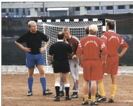
Fodboldkampene blev spillet både på kunstgræs og grus.

Her skulle Scan Produktion have spillet mod VVS firmaet Chr.