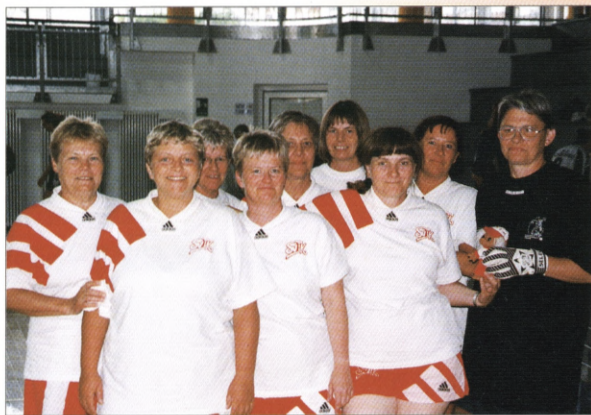
SVIK-pigerne har været med siden 1989.