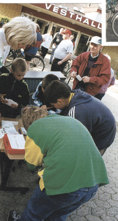
Startkortene udfyldes. Det koster en femmer at være med, og så er chancen for en gevinst noget større end i lotto.

i Slagelse der er flinke til at støtte os.