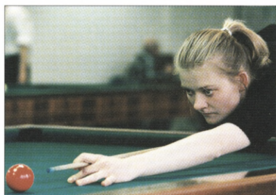
Aalborg Firmasport indbyder til damedyst i billard.