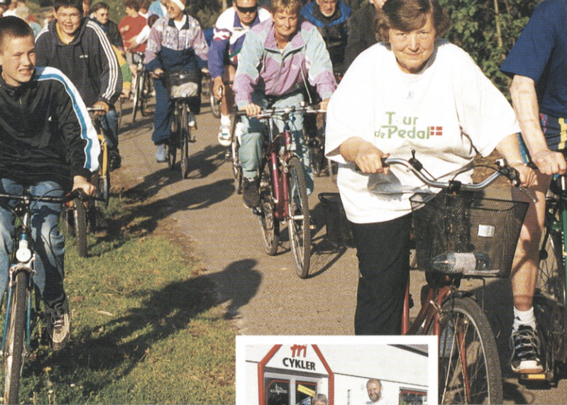
Fart i cyklerne fra starten på den sidste Tour-aften i Slagelse.