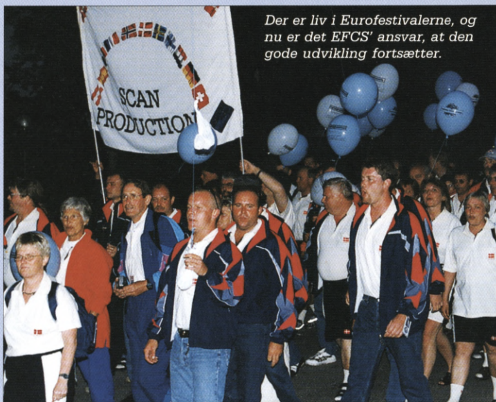
Der er liv i Eurofestivalerne, og nu er det EFCS' ansvar, at den gode udvikling fortsætter.

Der er et gammelt ordspil der siger: „lige børn leger bedst“. Det må være et af EFCS's (European Federation of Company Sports) ønsker til de