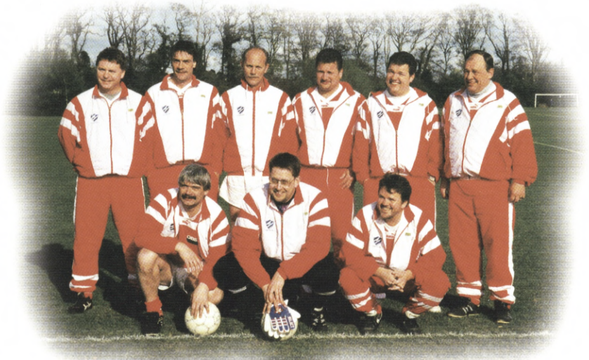
Optimismen var stor for DEN STORE KAMP.

Torsdag formiddag blev benyttet til et besøg på Jamesons whiskey-destillery museum, hvor hele gruppen blev præsenteret for en fin og letforståelig rundvisning med efterfølgende smagsprøver af dette "livets vand". Og så var det ellers ud i byen for at shoppe og se sig omkring og alt det dér. Ikke nogen billig by må i sandhedens tjeneste understreges.