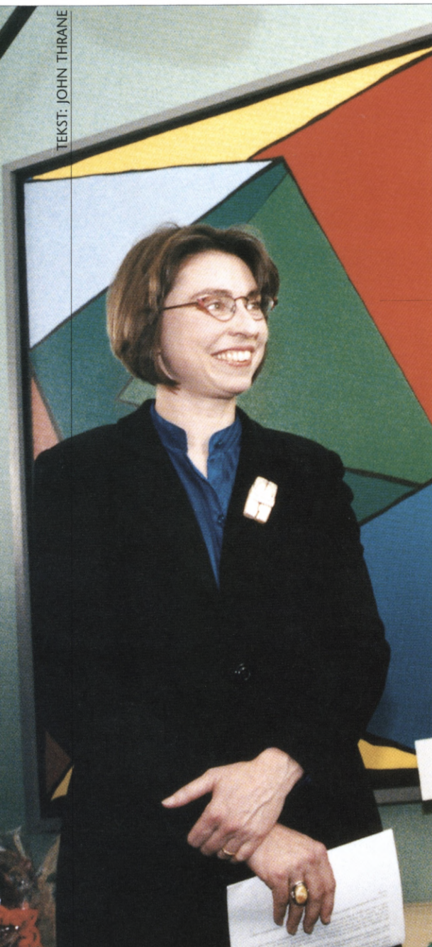
Kulturminister Elsebeth Gerner Nielsen satser med et nyt tipslovsudspil på et bredt forlig inden sommerferien.

Nyt forslag til tipslov betyder et minus på 41,8 mio. kr. for idrættens organisationer.