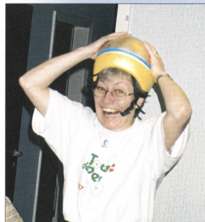
Kis med det nye sikkerhedsudstyr specielt udviklet til petanque-spillere.

valg af kugler og der var nogle stykker som købte nye, også selv om pengene var brugt på en ny kjole. Så må der spares bagefter, blev der sagt. Efter endt prøve og afsluttende turnering fik alle kursusbevis, trøje og klud, som tegn på at kurset var vel bestået. Vi sagde pænt farvel til hinanden og bad om at vi på et senere tidspunkt kunne mødes og udveksle erfaringer og få nye impulser. Så nu er det op til os og Jer hjemme i foreningerne om at bruge af vor indvundne erfaringer. ♦