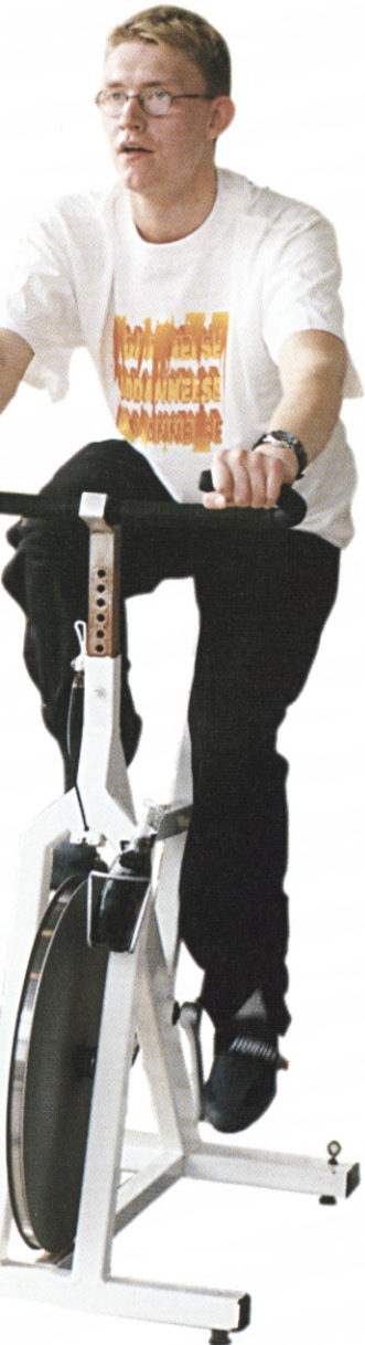
DFIF's uddannelsesudvalg præsenterede en ny idrætsgren for formændene. Spinning - en træningsform der kommer fra USA. I øjeblikket går sin sejrsgang i Norge, og er stærkt på vej frem i Danmark.

kan ses på DFIF's hjemmeside: www.dfif.dk