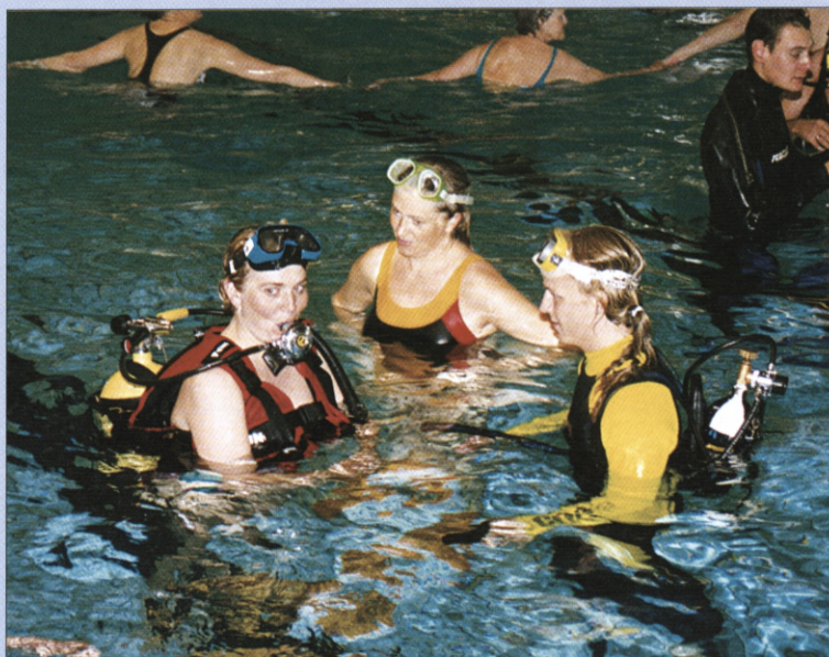
Tipsmidlerne til Foreningen til fremme af Motion og Idræt i dagtimerne (FMI), der er paraplyorganisation for ca. 150 Idræt om Dagen-projekter landet over, skal med regeringens nye udspil til tipsloven stadig findes i Kulturministeriets pulje til idrætsformål.